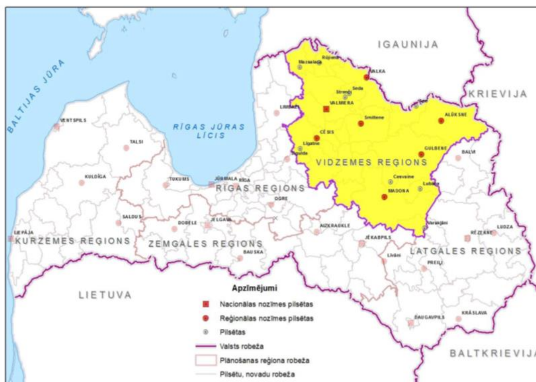
1.attēls. Plānošanas reģionu izvietojums Latvijas teritorijā

Vidzemes plānošanas reģions (turpmāk – VPR) ir viens no 5 (pieciem) plānošanas reģioniem, kas ir teritoriāli lielākais Latvijā, aizņemot 23,6 % no valsts teritorijas. Tā kopējā platība ir 15 245, 43 km 2 .