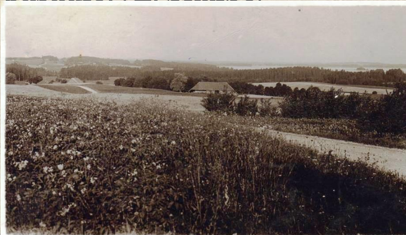
Inesēnu kalna panorāma, Vecpiebalgā

Kluss sapņu baltums ar prieka galotnēm skaļām. /J. Akuraters/