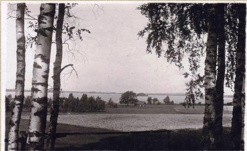
Alauksta ezers Vecpiebalgā