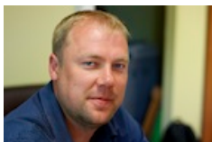
Projekta koordinatori: Gatis Teteris