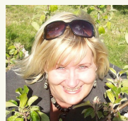
Rakstu autore: Vidzemes plānošanas reģiona kultūras ekspekte Olita Landsmane

Jāņa Poruka iela 8 108. kabinets, Cēsis Cēsu novads, LV-4101 Tālr.: 6411 6006 Fakss: 6411 6012 vidzeme@vidzeme.lv