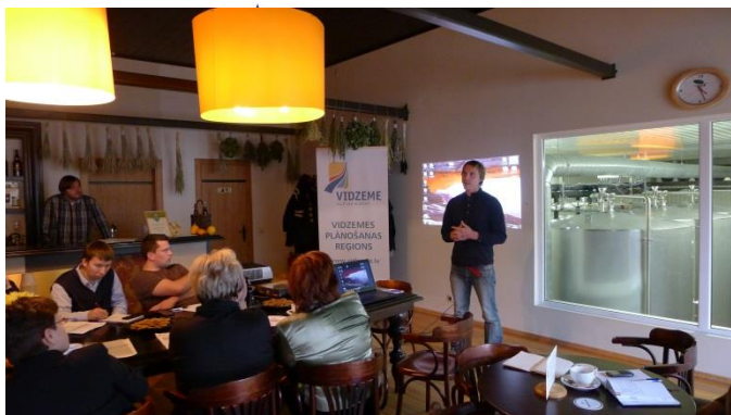
Foto: Pārtikas klastera biedri tiek sanāksmē Valmiermuižā

Esam gandarīti, ka klasterim ir iespējas attīstīties, saņemot arvien jaunus sadarbības piedāvājumus, kas dod iespējas klastera dalībniekiem gūt pieredzi un pilnveidot savas prasmes. Tā, piemēram, šobrīd notiek aktīva komunikācija ar Magdeburgas tirdzniecības un rūpniecības kameru (Vācija) par iespēju piedalīties vērienīgajā izstādē „Europa-Markt 2014”, kas norisināsies no 8 līdz 10. maijam Vācijā. Šādas izstādes ir lielisks veids, kā vairot vērtīgus kontaktus, iepazīties ar izplatītājiem un