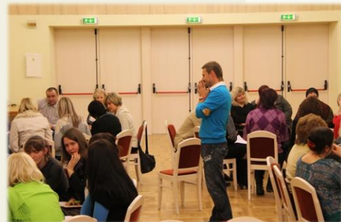
Foto: Kultūras darbinieki radoši risina uzdevumus