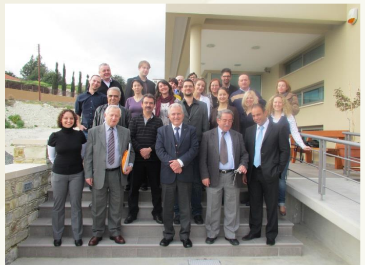
Projekta partneri seminārā Larnakas reģionā