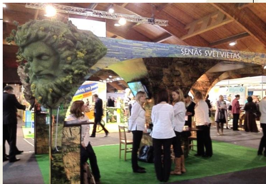
Projekta „Senās kulta vietas - Baltijas jūras piekrastes kopīgā identitāte” izstāžu stands piesaistīja daudz interesantus

ES fondu informācijas centra vadītāja: Ina Mīkelsone