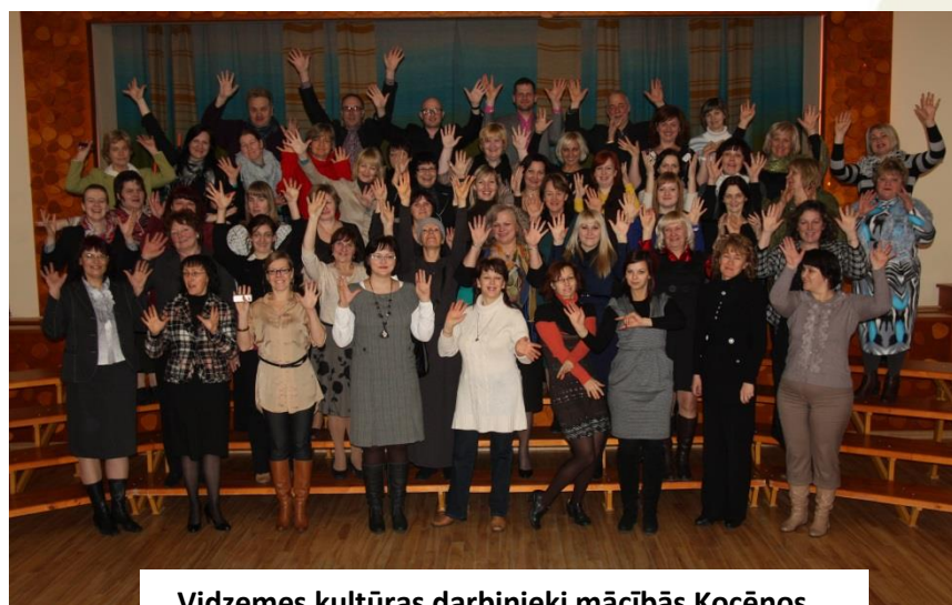
Vidzemes kultūras darbinieki mācībās Kocēnos

Vidzemes plānošanas reģions Jāņa Poruka iela 8 108.kabinets, Cēsis Cēsu novads, LV-4101 Tālr.: 64116006 Fakss: 64116012 vidzeme@vidzeme.lv