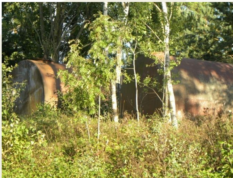
Piesārņojuma riska objekts – amonjakūdens mucas, kas atrodas netālu no 30.08 semināra norises vietas