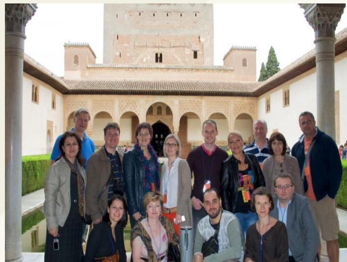
Projekta partneri vienā no senioru tūrisma labās prakses piemēriem Granadā – Al Hambras pils