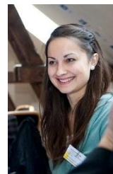
Raksta autore: Telpiskās attīstības plānotāja Anda Eihenbauma