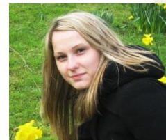
Projekta koordinatore: Lelde Gavare

Eiropā un arī citviet pasaulē nozīmīgāka kļūst „zaļā” jeb videi draudzīgā pārvietošanās, kad cilvēki arvien biežāk cenšas izmantot alternatīvus pārvietošanās veidus tāds kā - velosipēds, elektriskais velosipēds un elektromobilis. Lai apzinātu situāciju, augusta nogalē Vidzemes plānošanas reģiona pārstāvji projekta „Pārvietojies zaļi” partneru sanāksmē dalījās pieredzē par Vidzemes reģiona transporta sistēmas plānošanu un uz klausīja pārējo projekta partneru risinājumus ilgtspējīga transporta organizēšanā. Uzzini par pirmajiem pētījuma rezultātiem šeit .