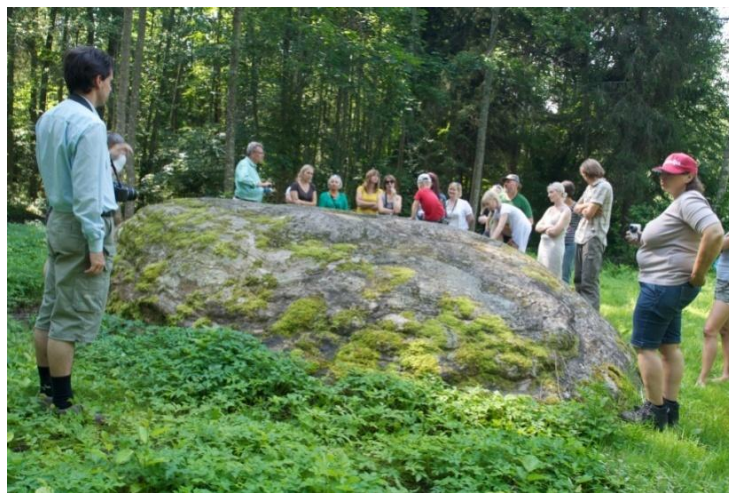
Pilot maršrutu izvērtēšanas brauciens Vidzemē