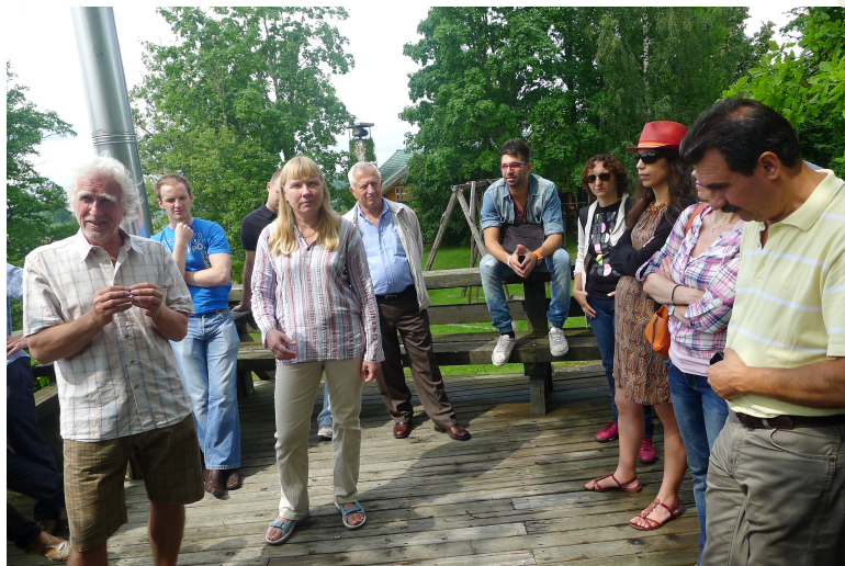
Mācību vizīte Amatiemā