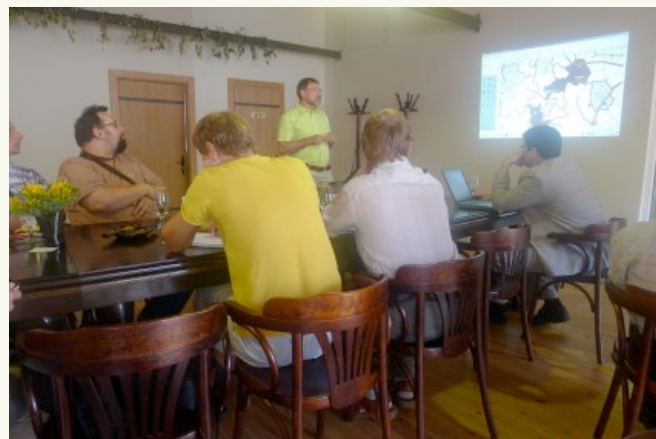
IT speciālistu tikšanās Valmiermuižas Alus telpās

Ātrgaitas internets lauku teritorijās, Publiskie interneta pieejas punkti, diskusijas par aktualitātēm IT jomā. Šie un citi temati tika pārrunāti seminārā „Eiropas reģionālā attīstības fonda ieguldījums Vidzemes reģiona IKT infrastruktūras attīstībā”. Vairāk lasiet šeit .