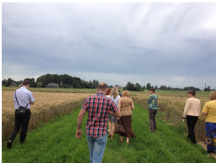
Tikšanās dalībnieki apskata Valsts Priekuļu laukaugu selekcijas institūta selekcijas laukus.